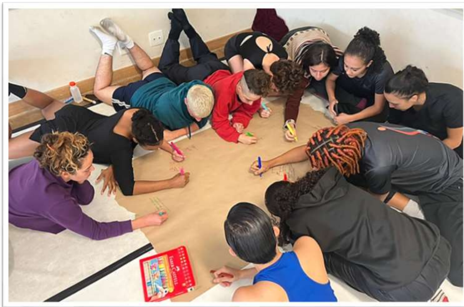
Grupo inventivo realizado no Balé Jovem / CRJ