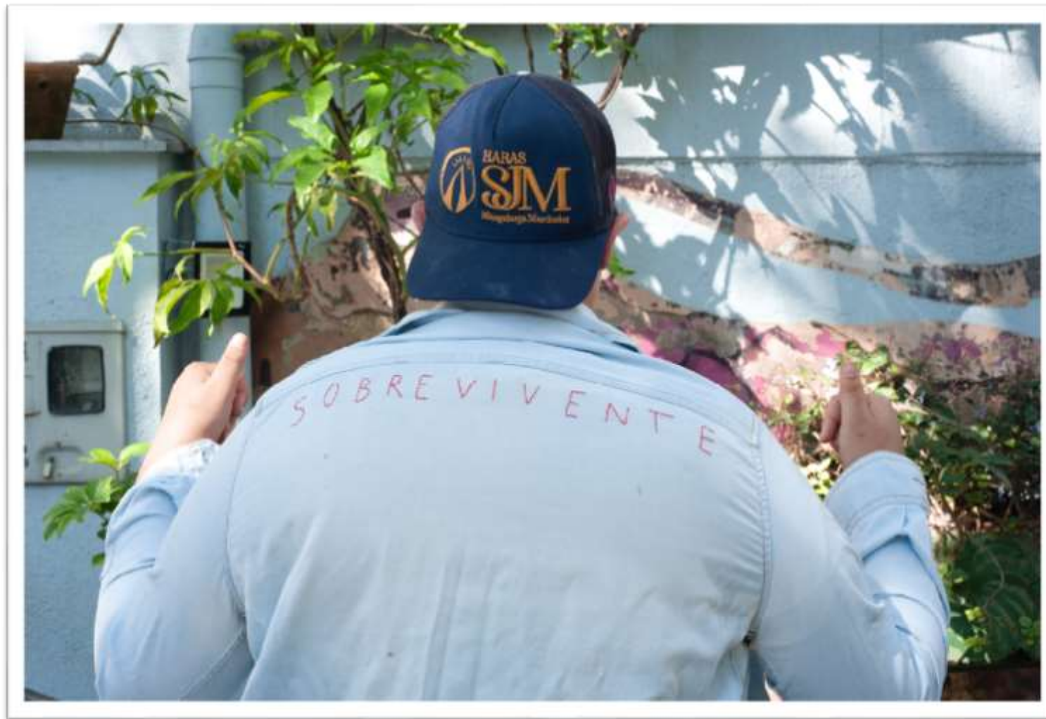
Adolescente vestido camisa com o bordado “Sobrevivente”